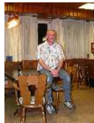
Ein aufmerksamer Beobachter